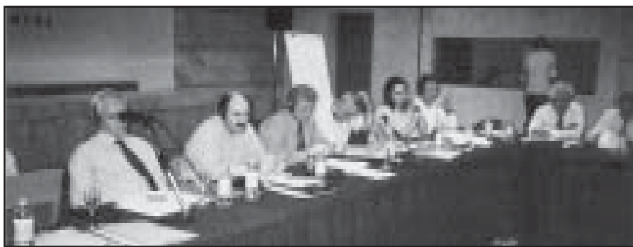
Pamje nga zhvillimi i punimeve të Konferencës së KSSH dhe BSPSH, bashkëpunim me ICFTU mbi eliminimin e punës së fëmijëve

Konferenca, e zhvilluar në tetor të vitit 2004, përcaktoi disa nga veprimet që duhen ndërmarrë nga dy qendrat sindikale kombëtare, KSSH dhe BSPSH, për luftën kundër punës së fëmijëve: