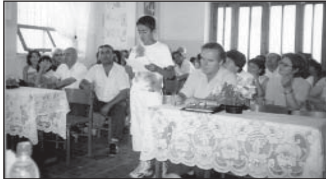
Në njerën nga seancat e seminarit në Shkollën "Dino Ismaili" në Levan të Fierit

presioni potencialisht i fuqishëm, sindikatat duhet të luajnë një rol të rëndësishëm në bisedimet për kontratat