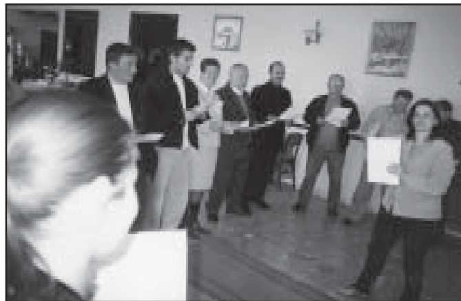
Pamje nga seminari i zhvilluar me ILO-IPEC ne Korçe

me konceptin dhe standardet nderkombetare mbi punen e femijeve, prezantimi i Librit « Sindikatat dhe Puna e Femijeve » dhe analiza e gjendjes ne rrethin e Korçes e te Beratit dhe rrethet fqinje me to, duke pergatitur edhe planet