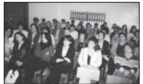
Në njerën nga seancat e seminarit në Shkollën "Jeronim De Rada" në Elbasan

Për vitin 2004-2005 në rrethin e Elbasanit e kanë braktisur shkollën 335 nxënës, prej të cileve 116 ishin të