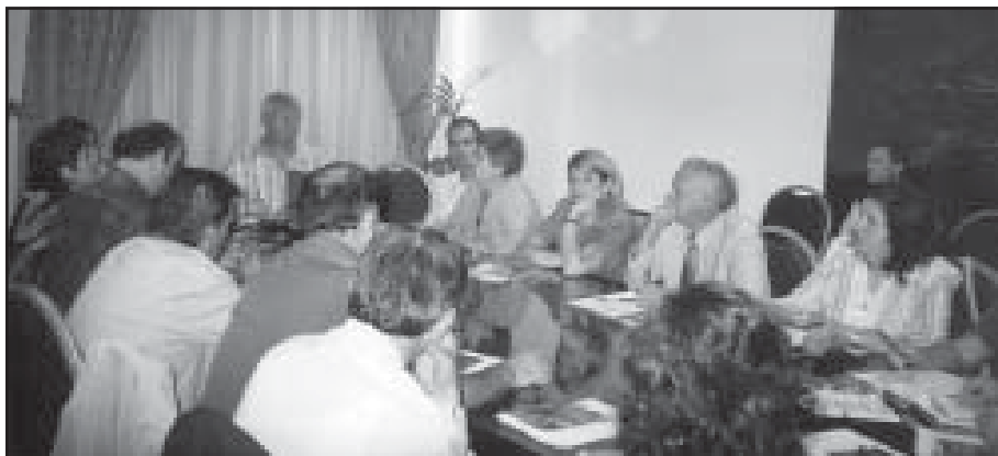
Çast nga Tryeza e Rrumbullaket per diskutimin e Draftit te Librit "Sindikatat dhe Puna e Femijeve"

Broshura e Katërt, me titull "Fushatat Kunder Punes se Femijeve", pasi ben nje historik te zhvillimit te Fushatave nga sindikatat ne keto 100 vjetet e fundit,